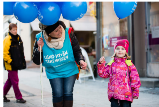
Kirkkoon liittyi ennätysmäärä uusia jäseniä. Turun alueella seurakuntaan liittyi 731 uutta seurakuntalaista, mikä on tämän vuosituhannen ennätys.