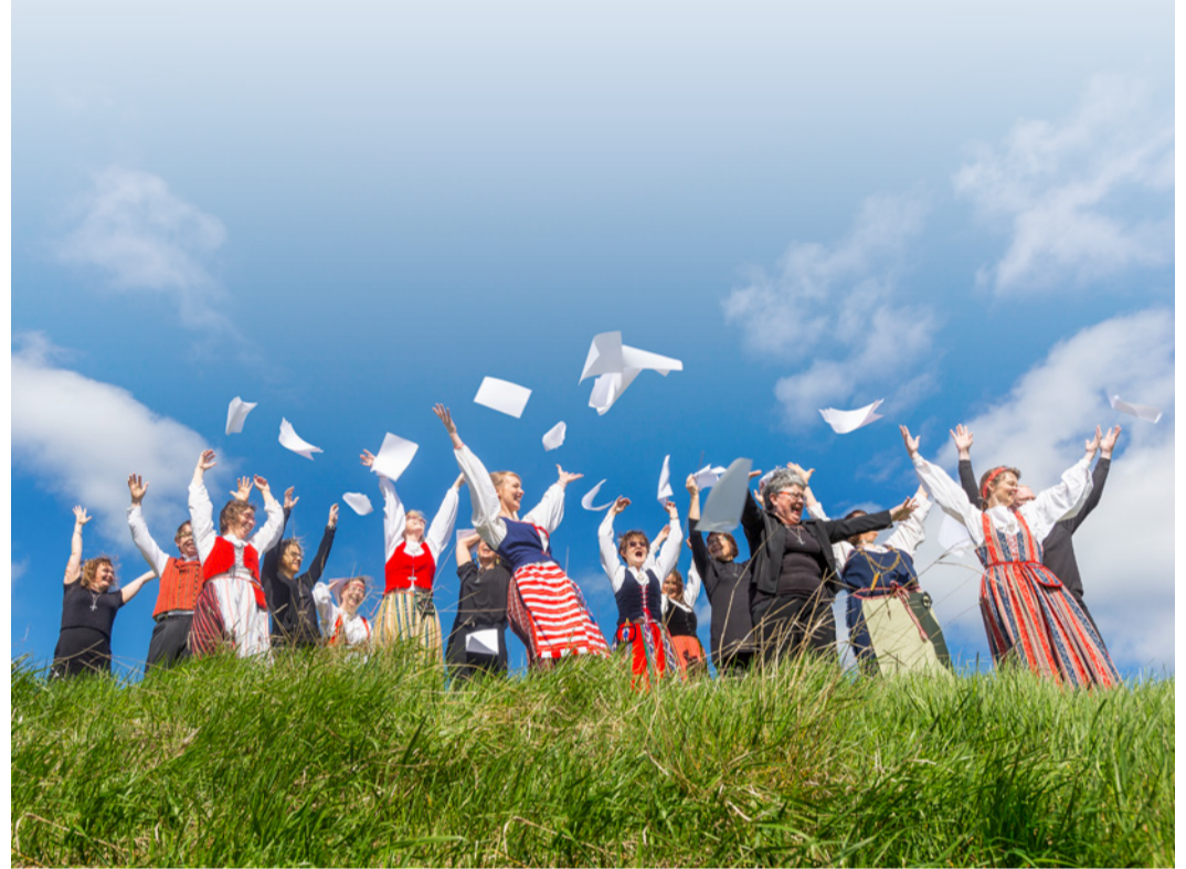
Maarian Verbum Sonans -kuoro valmistautui kansanlaulukirkkoon ja kuorolaiset olivat siksi asianmukaisesti sonnustautuneet kansallispuhuihin.

- Meillä on innostava johtaja, joka myös osaa opettaa laulamista. Lisäksi on kivat kuorokaverit – minulle henkilökohtaisesti on tärkeää sekin, että laulamme kirkossa. Soli Deo Gloria, Jumalan kunniaksi, kuten sanotaan.