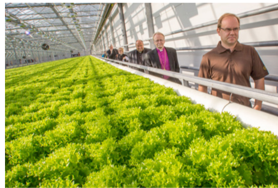
Piispantarkastus järjestettiin muun muassa Paattisilla. Seurakunnan asioiden ohella arkkipiispa Kari Mäkiselle tarjottiin myös salaattikerros Oksasen puutarhassa.