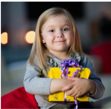
Jo perinteeksi muodostunut Lahja lapselle -keräys oli jälleen menestys. Vapaaehtoiset toteuttivat vähäosaisten lasten lahjatoiveita 830 kappaletta.