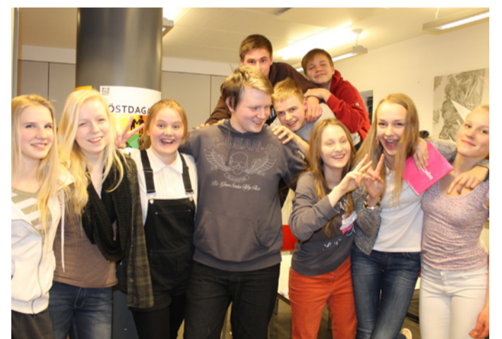
Åbo svenska församlings skriftskolor inleds nuförtiden med ett läger, och konfirmationsundervisning hålls under hösten och vintern.

I samarbete med Turun tuomiokirkkoseurakunta ordnades en konsert 27.6 till påminnelse av Uppsala ärkestifts 850 års jubileum med nykomponerad musik av Niklas Winter.