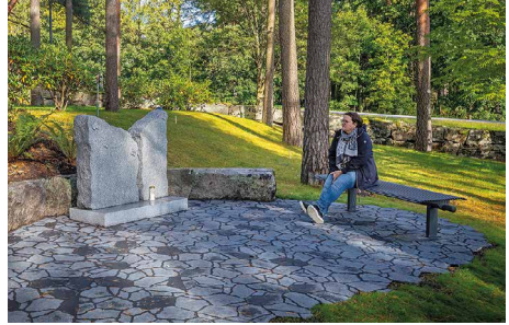
Turun hautausmaalta löytyy myös lasten muistolehto ja tyhjän sylin muistomerkki.

Muistolehdoissa on yleensä paikka omaisten kukille ja kynttilöille. Niihin saa tuoda vain leikkokukkia. Poikkeus on Kärsämäen metsähauta-alueen muistolehto, jonne ei saa tuoda kukkia tai muita kasveja. Lyhyille ei ole varattu tilaa muistolehdoissa.