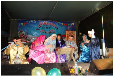
Kuva 3. Teatteri puhuttelee Thaimaassakin. Viereinen palaute kertoo miten