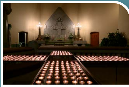
Toivon kynttilät pyhäinpäivän iltakirkossa.