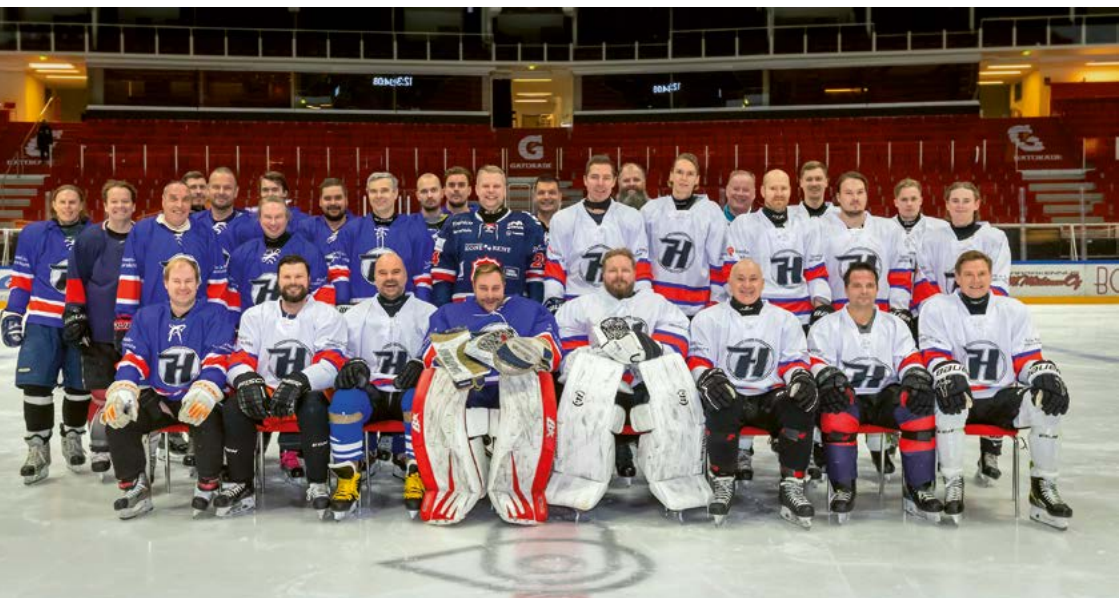
20 vuotta täyttänyt HC Hurmos juhlaottelussa Gatorade Centerissä.

Jääkiekkotiimi HC Hurmos piti vauhtia Timon luotsauksessa sunnuntai-iltaisain Kupittaan harjoitus-hallissa. Kertomusvuonna HC Hurmos yleisöluistelujen tapaan täytti 20 vuotta. Juhlavuoden merkeissä pelattiin juhlaottelu, hankittiin uudet peli-