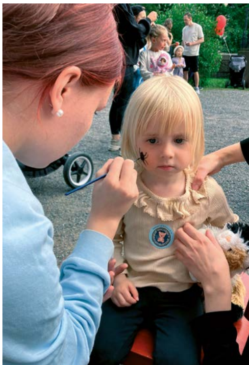
Kirkonmäkitapahtumassa tehtiin hienoja kasvomaalauksia.

Arviointina toteamme, että perhetyössä aloitimme uusia toimintamuotoja ja osallistuminen toimintaan kasvoi. Perheiden määrä ja osallisuus lisääntyi vuoden aikana paljon. Tavoitettavaa työtä toteutettiin aktiivisesti ja monipuolisesti. Instagram-tili @turunmikaelinsrklapset kautta saavutettiin alueen perheitä ja tiedotettiin ajankohtaisesta toiminnasta, se todettiin hyväksi matalankynnyksen tavaksi viestiä. Kevään ja syksyn toimintaisitteisiin koottiin ohjelma, jota jaettiin kohderyhmälle.