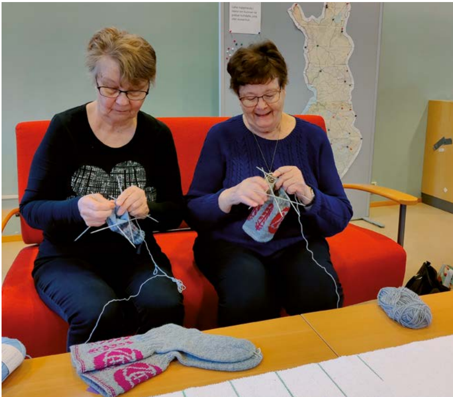
Neulnurkan naisia Mikael-sukkia kutomassa.

Keväällä organisoimme kaikille avoimen hernekeitto- ja laskiaispullatarjoi-