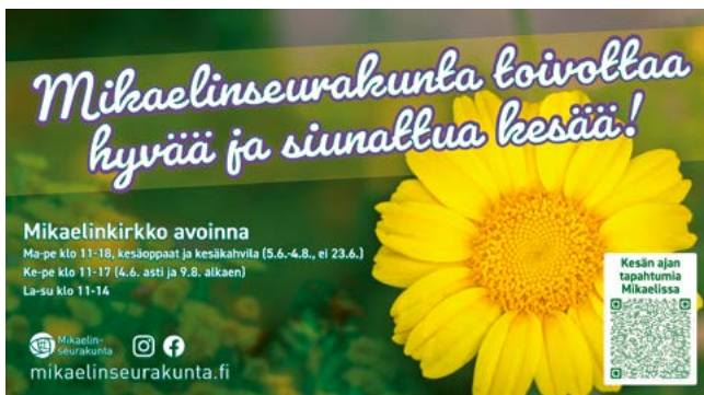
Kesäjän mainoslakana Mikonmökin seinässä.

tä saataisiin sähköinen ulkoilma- taulu, infotaulut kirkkoon ja Mikaelin seurakuntakodille. Lisäksi alueellamme olevia yhteisiä infotauluja kannattaa myös hyödyntää kohdennetusti.