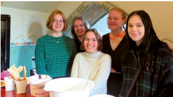
Nuorisotyö palveli aktiivisesti messun kirkkokahvien järjestelyssä.