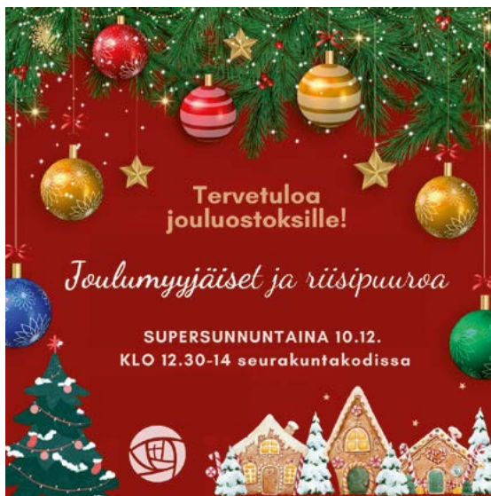
Joulumyyjäisissä lähetystyö on vastannut herkullisen riisipuuron valmistuksesta.