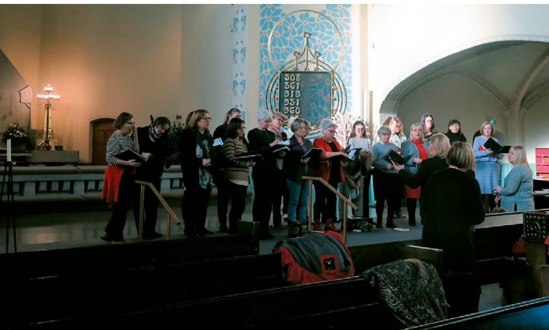
Yleinen äänioikeus Mikaelinkirkossa.

Kuoron kaudesta mainittakoon, että loppusyksystä Turun Sanomat kävi tekemässä jutun tammikuussa 2024 ilmestyneeseen Koulutus ja harrastukset-liitteeseen.