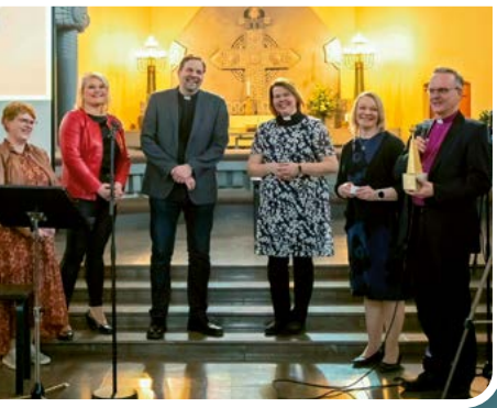
SuperSunnuntaista ArkkiPooki -palkinto Mikaelinseurakunnalle.