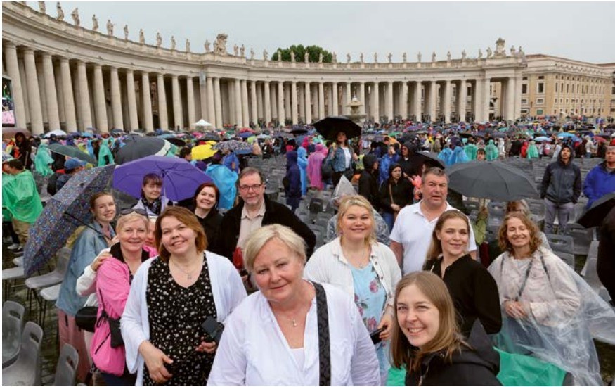
Työntekijät yhteismatkalla Roomassa ja varsinaisessa Vatikaanissa.