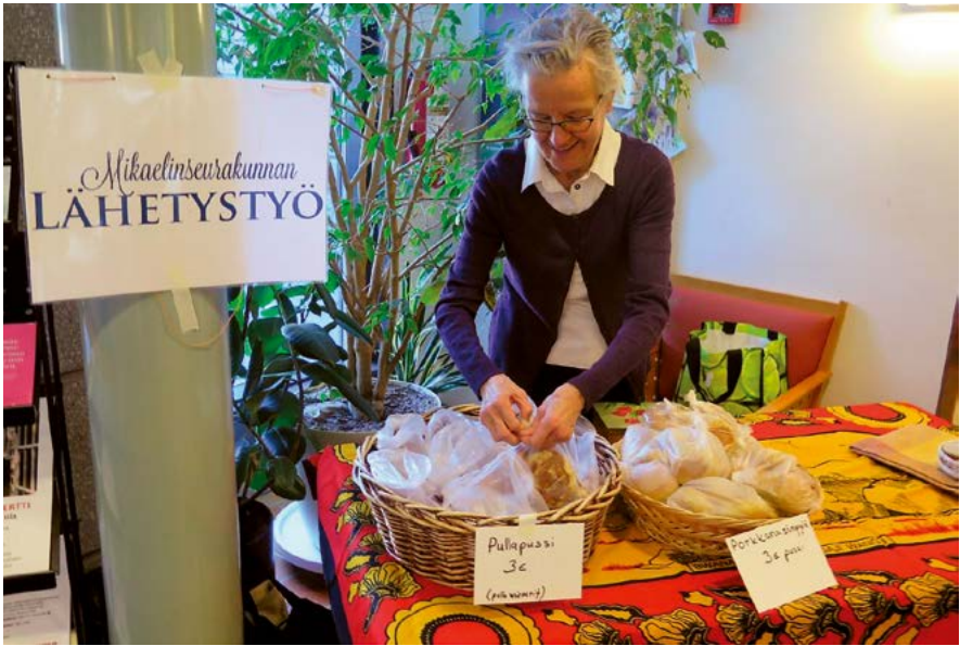
Lähetystyön värikäs pöytä ohravellitapahtumassa.