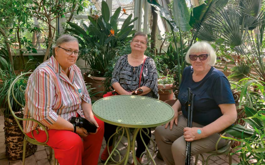
Kaffeplörö ja yhdessä -ryhmä teki retken Ruissalon kasvitieteelliseen puutarhaan.