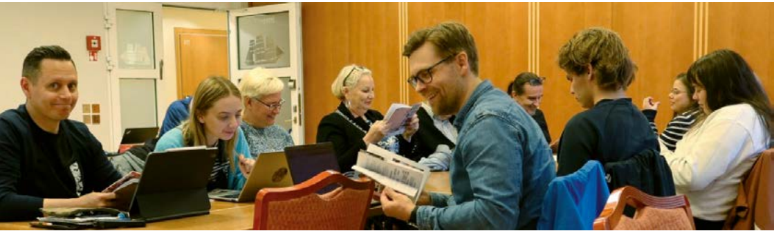
Seurakuntaneuvoston kokous Ruissalon kylpylässä.

Mikaelin seurakuntakodin neuvotteluhuone, seurakuntasali ja uuden seurakuntatoimiston neukkari. Muina kokouspaikkoina olivat Hotelli Kakola, Ruissalon kylpylä ja Rannikkolaivaston Pansion tukikohta.