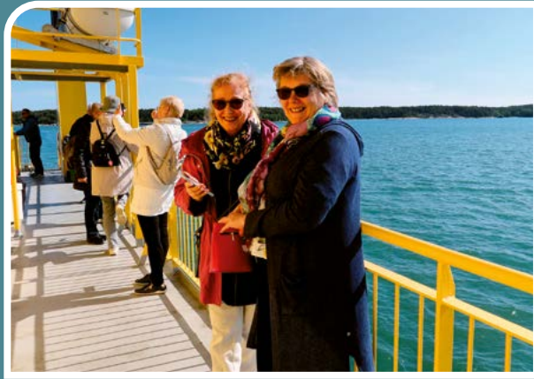
Saaristokierroksen iloista merimeininkiä.