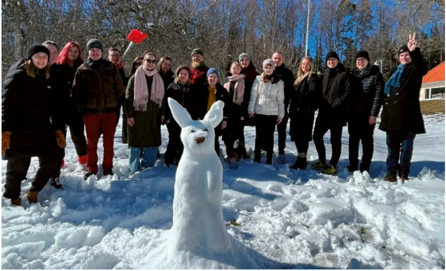
Nuorten aikuisten leiri ja lumiukko.