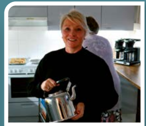
Suikkilan messun jälkeen kirkkokahvit maistuvat.