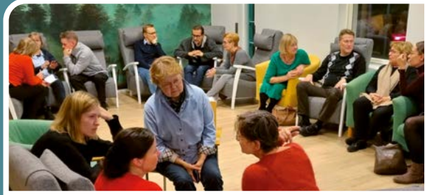
Klubi-tila koki uudistumisen.