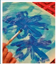
Voit myös harrastaa akvarellimaalusta Mikaelissa.