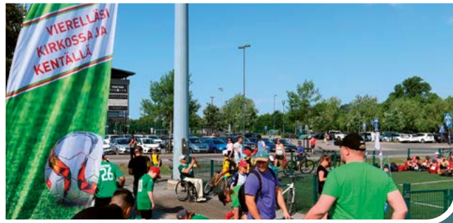
Soccer Cup - mukana juniorien tapahtumassa.