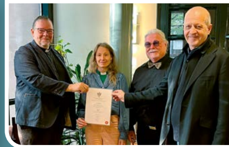
Lahjoitus Mikaelinseurakunnan diakoniatyölle.