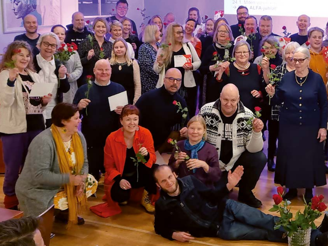
Alfa-kurssin päätösjuhla Mikaelin seurakuntakodilla.