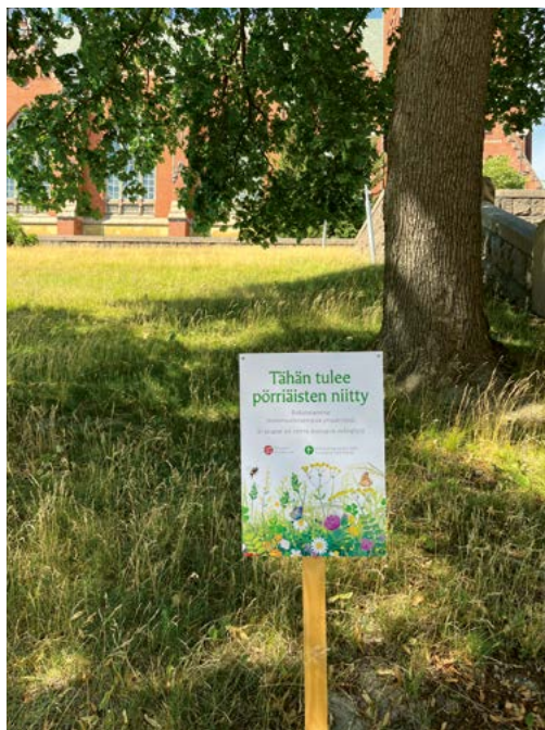
Kirkonmäen etelärinteellä kasvoi ensi kertaa pörräisten niitty.