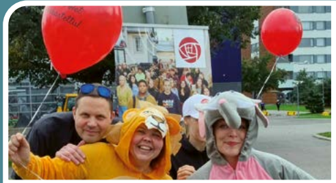
Jyrkkälässä saatiin seurakuntatoiminnalle uusi startti.