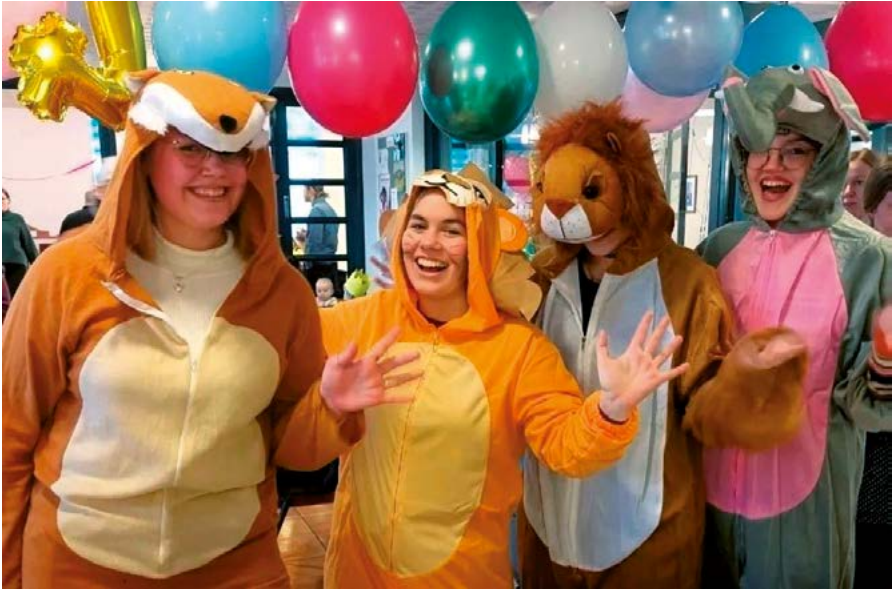
Isot eläinpuvuissa 4-vuotissynttäreillä.