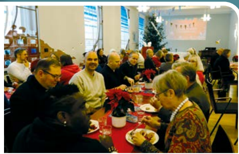
Vapaaehtoisten kiitosateria adventin tunnelmissa.