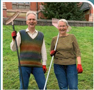
Pörräisniitty löysi paikkansa ja talkoolaisensa kirkonmäellä.