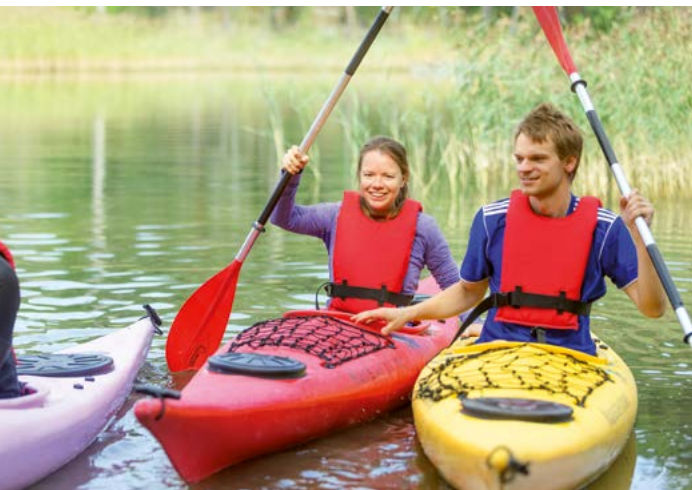
Nuorten aikuisten liikuntaleiri elokuussa.

asut ja kokoonnuttiin iltajuhlaan, jossa jaettiin ansiopystejä yhteisöllisyyden merkeissä.