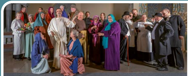
Mikael-teatterin Pääsiäisnäytelmässä oli juhlan tuntua.