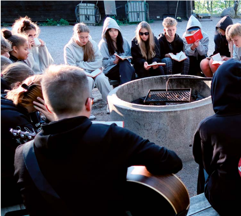
Rippikoululeirin iltaohjelma Eräkämpän maisemassa.