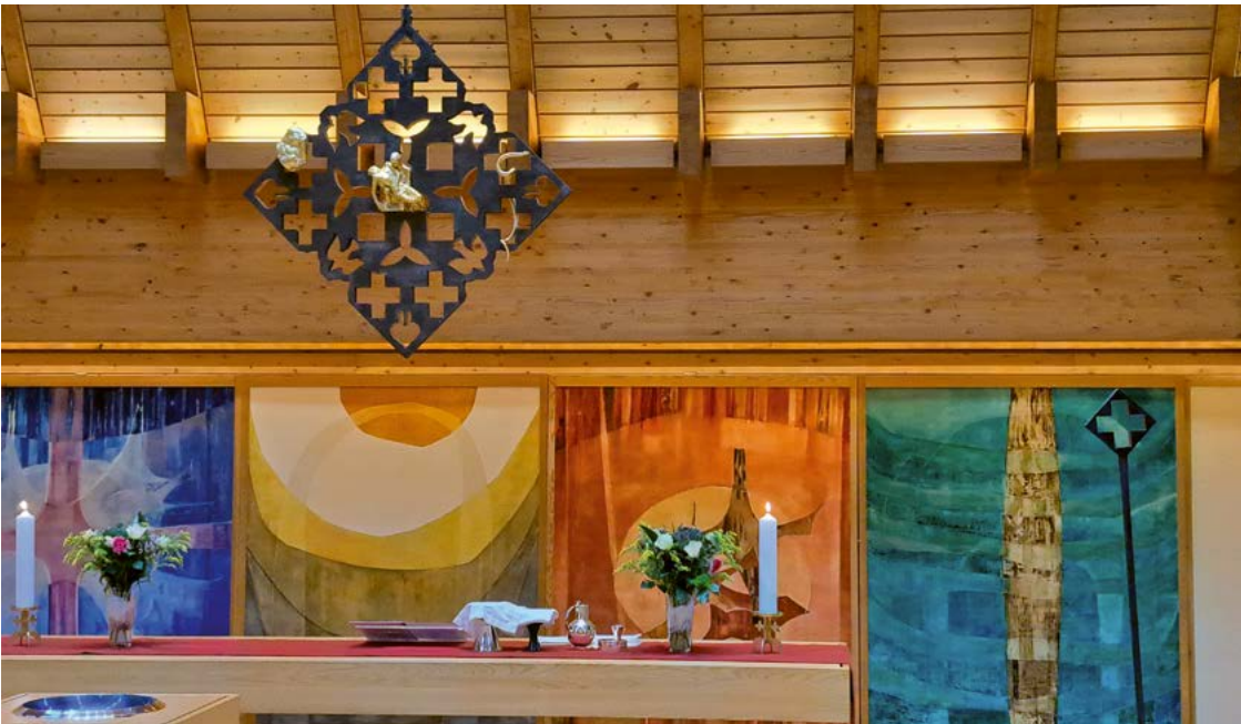
Søreiden kirkossa ovat käytössä liturgisten värien mukaan vaihtuvat alttaritaulut.