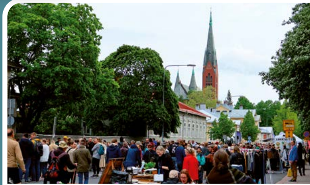
Porsan markkinat ja Mikaelinkirkko.