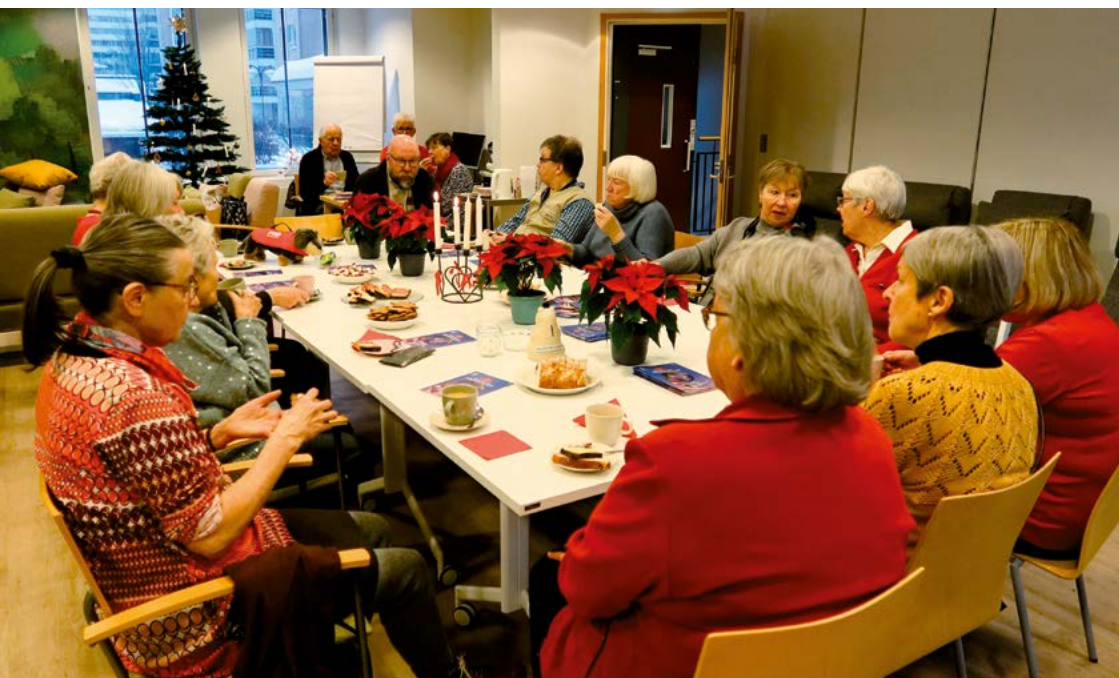
Piirin joulujuhla uudistuneessa Klubi-tilassa.