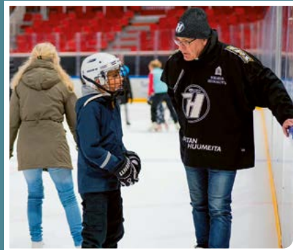
Tärkeä juttutuokio yleisöluistelussa.