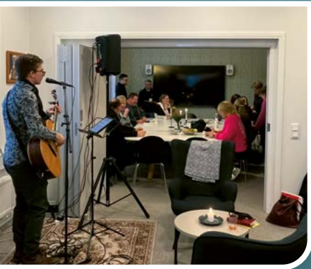
Seurakuntatoimisto siirtyi uusiin tiloihin marraskuussa.