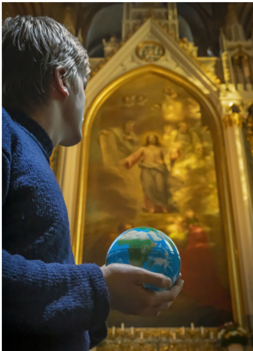
Medan planetens geologiska utveckling tidigare var helt reglerad av naturens blinda krafter bär nu varje extrem väderhändelse ett mänskligt fingeravtryck

Hoppet kan ta formen av praktiska åtgärder, att tillsammans göra något skapelsevänligt, något som föder och göder hoppet.