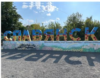
Kuva 1. FEBC-Ukrainalla aurinko paistoi kun Slavyanskissa ollut asema vaurioitui maaliskuun 13. päivä, mutta korjattiin ja toimii nyt.