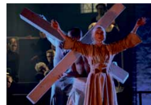
Hiljaisella viikolla Tuomiokirkossa nähtiin Tanssiteatteri Erin Passio-teos.