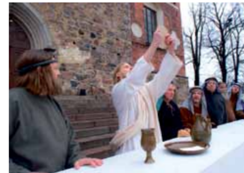
Pääsiäisenä esitettiin myös näytelmä Jeesuksen viimeisistä hetkistä. Kuva harjoituksista