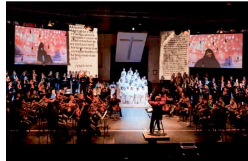
Logossa esitetty Matteuspasio oli ihan koko kulttuurivuottakin ajatellen yksi hienoimmista esityksistä.