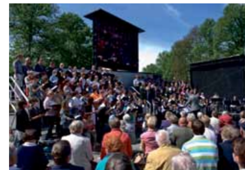
SuviVirvikirkkoon kokoonnuttiin helatorstaina laulamaan tuttuja virsiä – ja ennen kaikkea tietenkin suvivirtää.