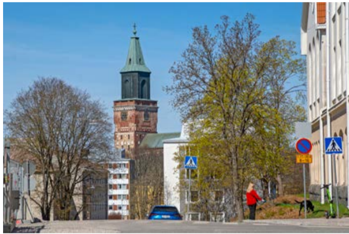
KUVA: TIMO JAKONEN

Huhtikuu: Eila Ekman-Björkman ja Maarit Björkman-Väliahdet Toukokuu: Kirsti Lento